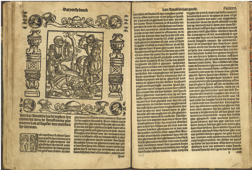
Ill. 4. Een schoone historie van den seer vromen Amadijs van Gaule, Antwerpen: Marten Nuyts, 1546; ex.: Mettingen: Draiflessen Collection, fol. 80v.

waarvan ik er hier twee exemplarisch als voorbeeld zal bespreken om twee werkwijzen duidelijk te maken. In het exemplaar van Nuyts' Amadijs -uitgave komen 42 houtsneden voor. Ten eerste gebruikte Nuyts houtblokken (Ill. 4) van Vorsterman die deze in zijn Margarieta -uitgave had afgedrukt 15 . De hier getoonde illustratie past heel goed bij de tekst van de Margarieta -roman omdat Etsijtes, één van de hoofdfiguren, twee reuzen doodt, waarvan één al op de grond ligt. De illustratie maakt het verschil in lengte duidelijk omdat de staande reus links net zo groot is als Etsijtes op het paard. In het hoofdstuk in de Amadijs gaat het om een gevecht tussen Amadijs en een andere 'gewone' ridder. Hier past de illustratie niet goed omdat er drie vechters, waarvan twee reuzen, zijn afgebeeld en omdat er in de tekst maar twee gewone ridders met elkaar vechten. Hieruit kan men concluderen dat Nuyts, net als zo veel collega's in zijn tijd, er meer belang aan heeft gehecht om zijn drukken van illus-