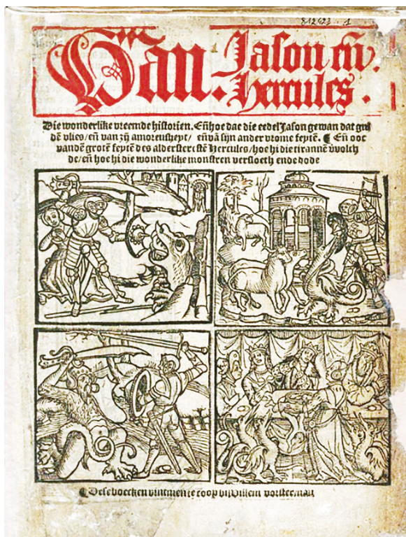
Ill. 2. Van Jason ende Hercules , Antwerpen: Jan van Doesborch, [ca. 1525]; ex.: Antwerpen, Erfgoedbibliotheek Hendrik Conscience, titelblad

gebruikt, uitkomst bieden. Deze initiaal is te vinden bij het begin van de proloog in de eerste tekst, de Jason , en later bij de Hercules (fol. D4r). In beide teksten is deze initiaal van hetzelfde houtblok afkomstig 12 . Daardoor is het waarschijnlijk dat Jan van Doesborch beide teksten drukte die dan later bij Willem Vorsterman te koop waren, zoals het titelblad vermeldt 13 . Het gebruik van de meervoudsvorm dese boecken op het ti-