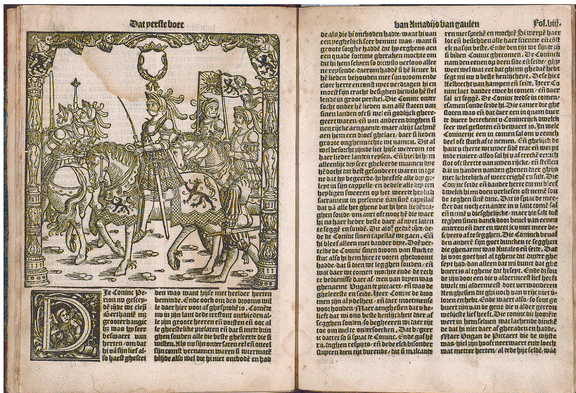
Ill. 5. Een schoone historie van den seer vromen Amadijs van Gaulen, Antwerpen: Marten Nuyts, 1546; ex.: Mettingen: Draiflessen Collection, fol. 7v.

traties te voorzien dat om precies passende illustraties te laten maken die (veel) kosten met zich mee zouden brengen. Al met al kan men een verwijdering van de samenhang tussen tekst en beeld vaststellen.