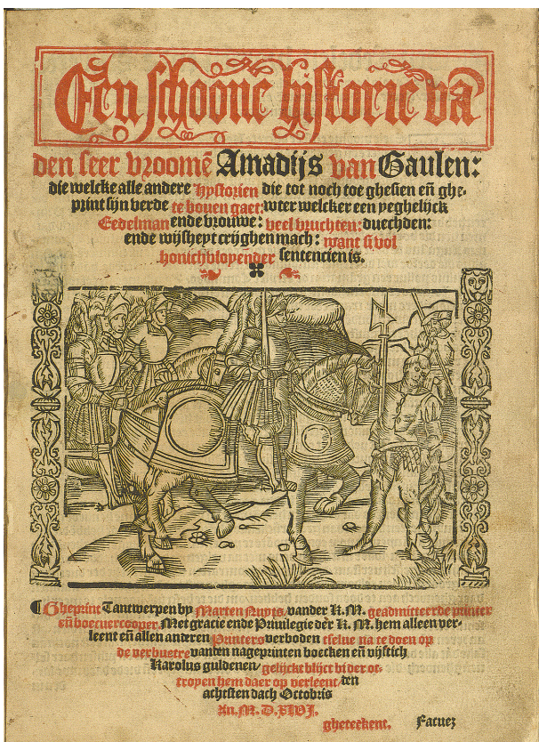
Ill. 3. Een schoone historie van den seer vromen Amadijs van Gaulen, Antwerpen: Marten Nuyts, 1546; ex.: Mettingen: Draiflessen Collection, titelblad

tingen in het noordwesten van Duitsland raadpleegbaar. Het exemplaar is niet compleet. Men gaat ervan uit dat ca. 4–5 katernen ontbreken. In totaal zijn 87 bladen met 42 houtsneden bewaard gebleven.