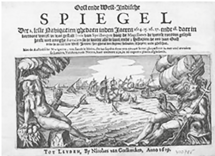
Fig. 4. Joris van Spilbergen, Oost ende West-Indische SPIEGEL ....., p. 18 r (BUWr 410785). Titelpagina

maar ook uit latere jaren. Enkele worden hier genoemd. Willem Cornelisz. Schouten heeft het Iovrnal ofte beschrijvinghe van de wonderlicke reyse (...) inde iaren 1615. 1616. en 1617 geschreven [Schouten, 1618, BUWr 402961]. Dirck Albertsz. Raven was de officiële auteur van het Journael van de ongeluckighe voyagie (...) naer Groenlandt, in den iare 1639 [Raven, z. j., BUWr 016680]. Jacques l'Heremite signieert voor het Journael van de Nassausche vloot, ofte Beschrijvinghe van de voyagie om den gantschen aertkloot [l'Heremite, 1652, BUWr 494014]. Johan Nieuhof beschreef Het gezantschap Der Neerlandtsche Oost-Indische Compagnie, aan den grooten Tartarischen Cham, Den tegenwoordigen Keizer van China [Nieuhof, 1665, BUWr 553558]. De tekst is zeer rijk versierd met stadsgezichten, kopergravuren, kaarten van verschillend format, “met over de 150. Afbeeldstels, na 't leven in Sina getekent”, zoals de lange titel vermeldde. Het werd ook vertaald in het Frans (ook in Wrocław aanwezig, BUWr 367241).