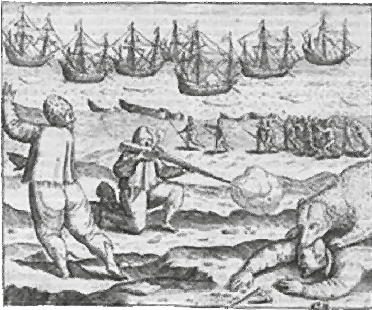
Fig. 1. Gerrit de Veer, De Waerachtighe beschrijvinge... , p. 18 f (BUWr 539554). Gevecht met een witte beer

terstont thoof in stucken/ende zoch het bloet daer uyt [De Veer, 1619, p. 17 v , BUWr 539554].