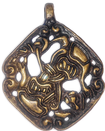
Рис. 1. Общий вид аверса зооморфного амулета

Предмет был случайно обнаружен вблизи кольцевого раннесредневекового славянского городища «Алчедар» в 2019 г. Из окрестностей села Алчедар также происходит денежно-вещевой клад, найденный осенью 2008 г., в составе которого находилась подвеска «гнездовского типа», впервые выявленная в Днестровско-Прутском междуречье [Рябцева, Тельнов, 2010, с. 291]. Таким образом, описываемый в настоящем исследовании амулет — вторая известная находка изделия