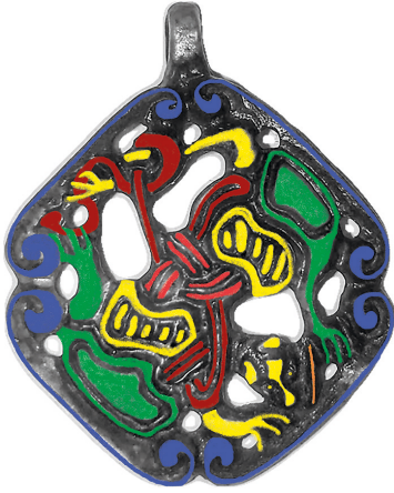
Рис. 5. Схема семантической составляющей амулета:

красный — тройной узел; бордовый — волшебная нить Глейпнир; желтый — передняя часть туловища «хватаящего зверя»; зеленый — задняя часть туловища «хватаящего зверя»; оранжевый — хвост «великого зверя» уличины — символ «уробороса»; синий — бортики внутренней ленты с волютообразно загнутыми концами