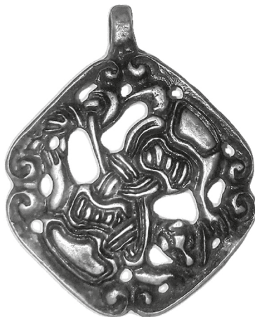
Рис. 1. Лицевая сторона скандинавского зооморфного амулета X в.

На реверсе подвески с прорезью, найденной у кольцевого городища близ села Алчедар, имеется руническое граффито 7 , выполненное скандинавскими рунами (рис. 2). Граффито является собой очень интересный образец рунической эпиграфики (рис. 4). Руническая надпись располагается вдоль левой верхней грани ромба на реверсе (рис. 2–4), что соответствует ее расположению на тыльной стороне правого верхнего «бугорка» аверса медальона (рис. 1), и занимает услов-